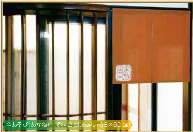
色あそび(あかね) 顔料 2 割(筒縫い 68×60 cm)