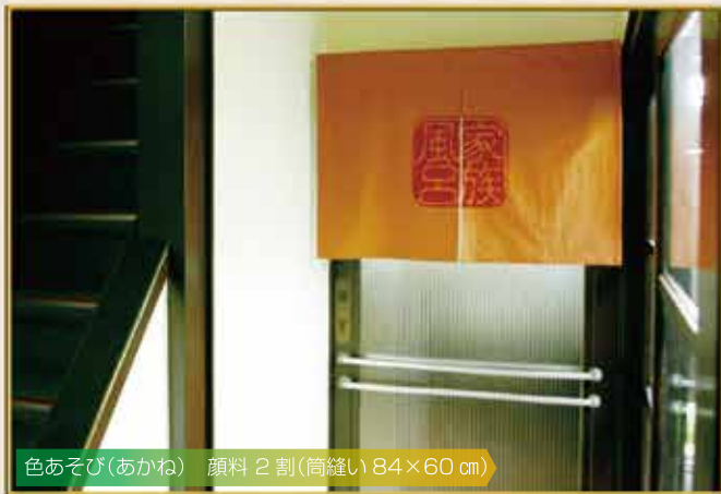
色あそび(あかね) 顔料 2 割(筒縫い 84×60 cm)