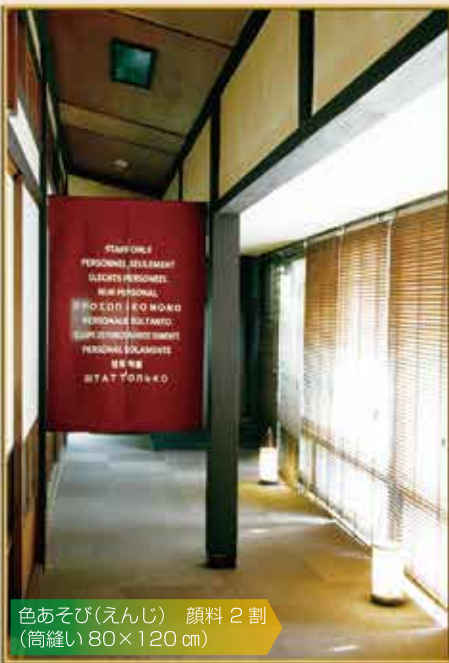
色あそび(えんじ) 顔料 2 割 (筒縫い 80×120 cm)