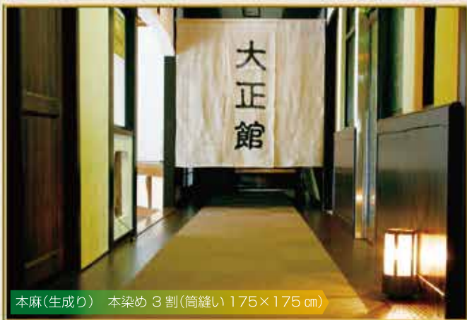
本麻(生成り) 本染め 3 割(筒縫い 175×175 cm)