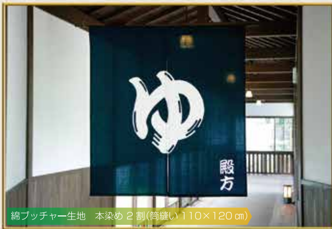
綿ブッチャー生地 本染め 2 割(筒縫い 110×120 cm)