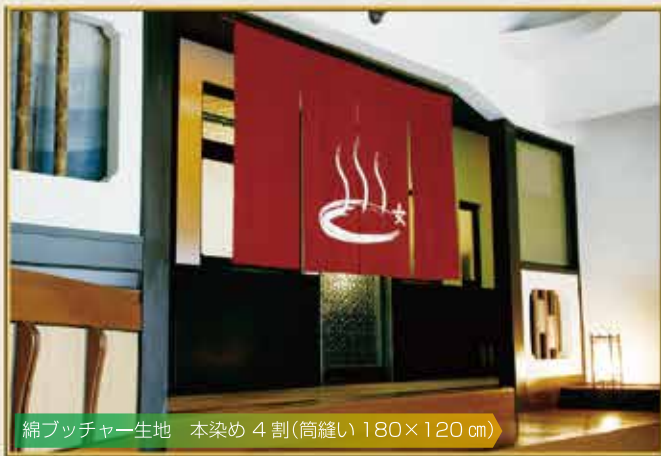
綿ブッチャー生地 本染め 4 割(筒縫い 180×120 cm)