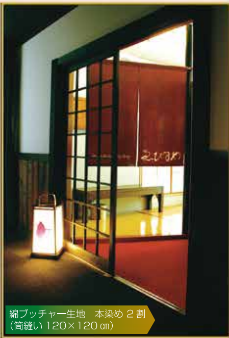
綿ブッチャー生地 本染め 2 割 (筒縫い 120×120 cm)