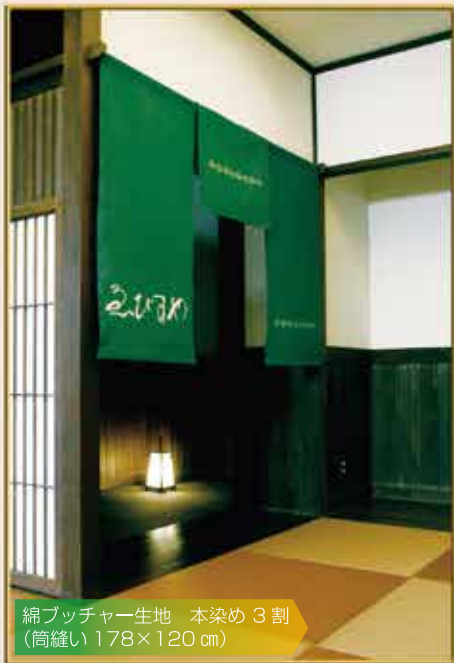
綿ブッチャー生地 本染め 3 割 (筒縫い 178×120 cm)