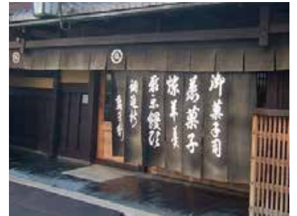
長暖簾(上部は水引暖簾)